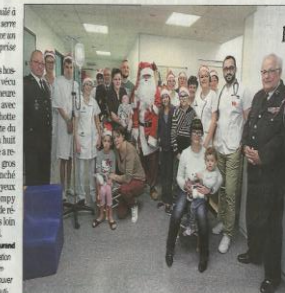
Les enfants du service de pédiatrie, entrants du personnel et de l'Amicale des Anciens Sapeurs Pompiers de l'Aude.

On connaît tous la générosité des pompiers, la profonde humanité que les sapeurs-pompiers ont pour ceux qui en doutent, le souffle d'un transport avec eux dans une intervention, l'air d'une opération à rajouter à leur crédit. L'Amicale des anciens sapeurs-pompiers de l'Aude a effectué des tournées dans les services pédiatriques des hôpitaux pour distribuer 60 nounours en peluche aux enfants hospitalisés. Un gain qui vient du cœur des pompiers, qui achètent eux-mêmes les peluches. Dans les casernes, une affiche incite les sapeurs à participer à l'opération « Achetez un Pompy ». 10 euros, un autre est offert pour un véhicule de secours.