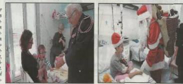
Des nounours sont aussi distribués par les sapeurs pompiers. | Papa Noël est là ! Mado serre Pompy contre elle.