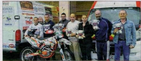
Les sapeurs-pompiers réunis avec les oursons.

Dorénavant, chaque véhicule d'intervention des sapeurs-pompiers de Genlis ne partira plus sans la nouvelle mascotte Pompy, destinée aux enfants.